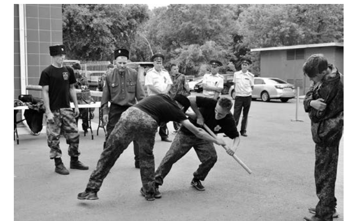
Казачья площадка пользовалась большой популярностью у горожан