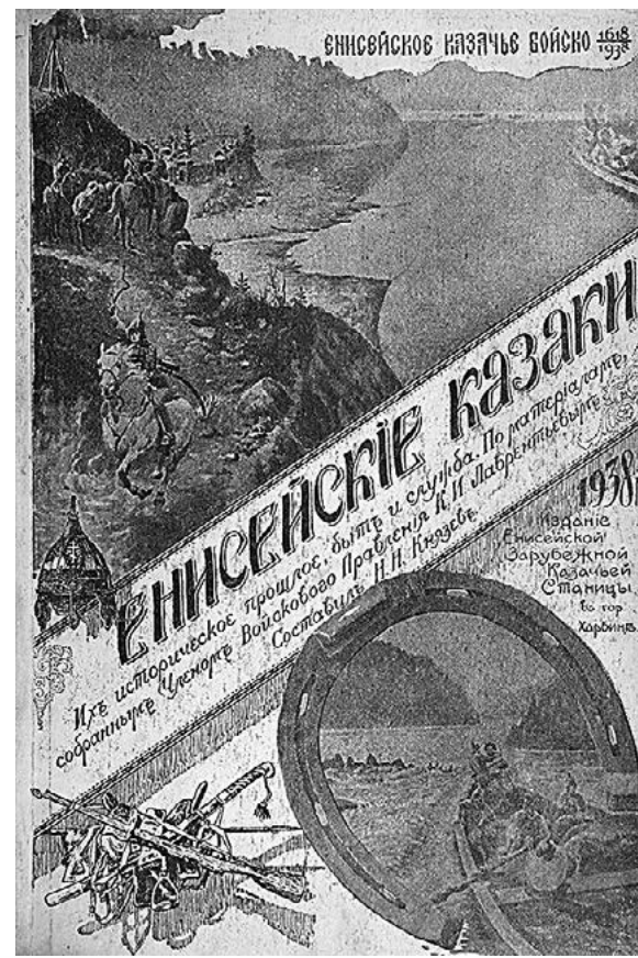
«Памятка Енисейского казачьего войска 1618г.-1938г.»