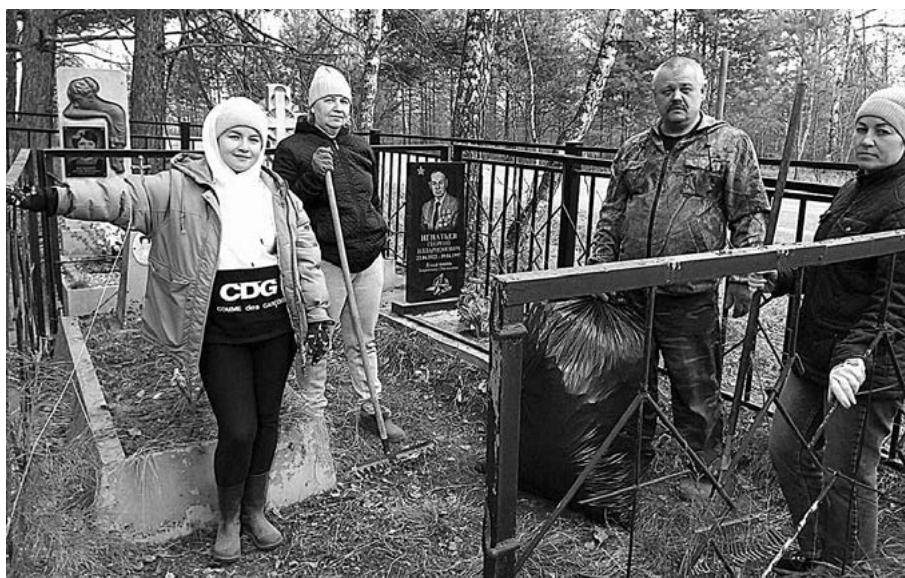
В рамках акции добровольцы убирают от мусора могилы участников боевых действий, очищают территорию кладбища от сухой травы